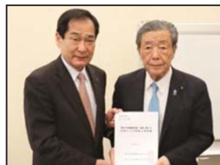
〔R7.11.26 森山先生への要請〕

令和7年度補正予算は12月16日に国会で成立し、令和8年度当初予算案は26日に閣議決定されました。既存の農業関係予算に加えて、別枠予算となる 農業構造転換集中対策 や 共同利用施設の再編・合理化 にかかる補助率の引上げ（補助率最大 2/3）などが盛り込まれました。