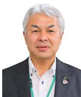
代表理事常務（信用・共済担当）