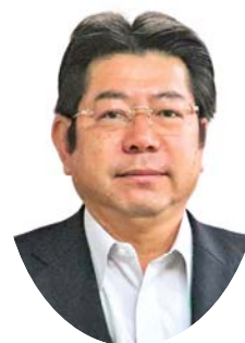
鹿兒島きもつき農業協同組合 代表理事組合長