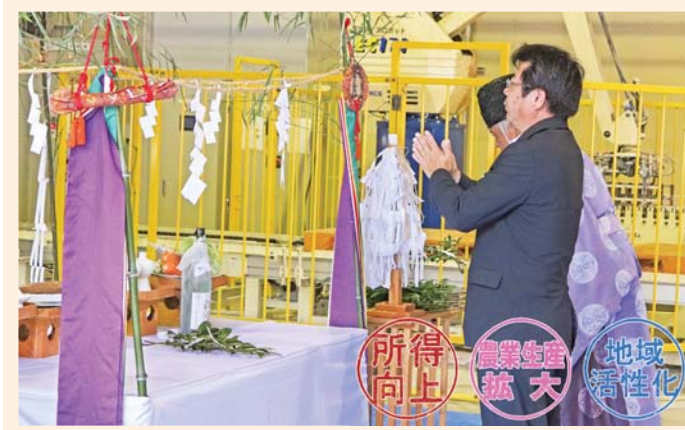
工場の安全操業を祈願する中野組合同長

PR 県ブランドピーマン関西で 東串良町園芸振興会は9月29日、兵庫県の神戸国際展示場で行われた