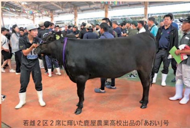
若雌2区2席に輝いた鹿屋農業高校出品の「あおい」号