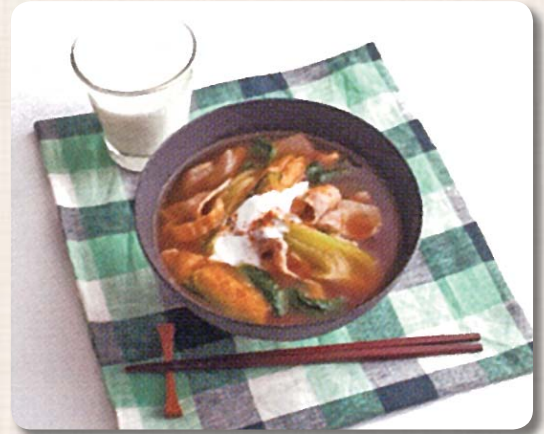
レシピ提供 ● 一般社団法人 Jミルク「ミルクレシピ」