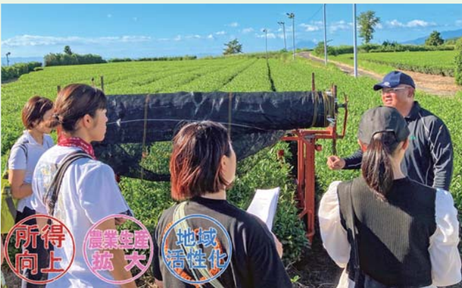
今村製茶の茶畑を視察する生徒ら

生徒らは、J A管内の茶畑や社会福祉法人白鳩会(南大隅町)などを視察。有機栽培の現状や農福連携の現場を確認しました。