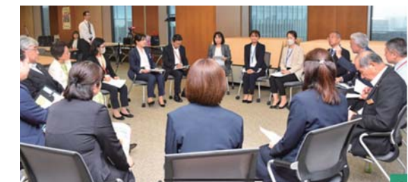
5月7日開催のJA女性職員活躍サミットの様子

サミットはJA鹿児島きもつき、千葉県JAいちかわ、神奈川県JAはなの、長野県JA松本ハイランド、JAぎふ、滋賀県JAグリーン近江、JAみえきたの7JAが5月7日に東京都大手町のJAビルで開いたもの。各JAからは組合長や女性職員らが参加し、女性の登用や職場環境の改善などについて意見交換しました。