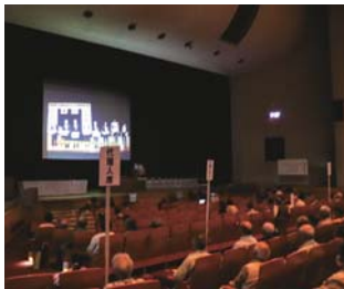
30周年記念取り組み動画を鑑賞する参加者

式典の中では、女性が活躍できる職場づくりを進めようと、JA鹿児島きもつき行動計画宣言を行った。