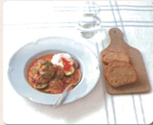
レシピ提供 ● 一般社団法人Jミルク「ミルクレシピ」