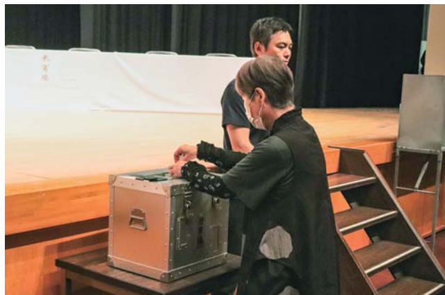
役員を選任に係る投票の様子

当JAは5月30日、鹿屋市で第31回通常総代会を開き、議決権行使書面を含む総代384人が出席のもと、令和5年度の事業報告や令和6年度の事業計画など、すべての議案をご承認いただきました。総代会後の臨時理事会で、任期満了に伴う役員改選がありました。