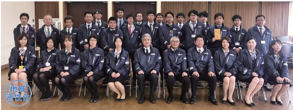
進発式に出席した役職員ら

JA共済部は4月10日、令和2年度ライフアドバイザー（LA）の進発式を開きました。LAは、利用者としてJA、JA共済をつなぐ重要な職員。今年度は26名が、利用者の利便性向上を目指し、管内を担当エリアに分けて活動します。現在、新型コロナウイルス感染拡大防止の観点から、訪問活動等を自粛しており、6月以降に再開を予定しておりますが、社会情勢を踏まえて慎重に判断する方針です。