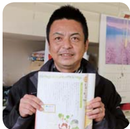
本所 園芸農産部 特販課 課長