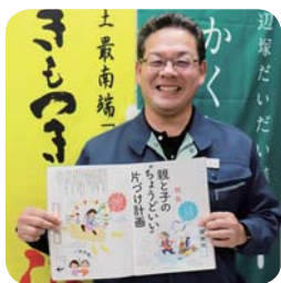
本所 購買部 購買課 課長