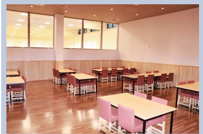
さいしよくほうび

農家レストラン「彩食豊美」では、『大隅まるごと感動レストラン』をコンセプトに、地域内外から訪れるお客様へ、かごしま黒豚や茶美豚のとんかつ、しゃぶしゃぶなどの料理をメインに、管内産の豊富な食材を使った料理をご提供。地域の魅力を「まるごと」味わえます。