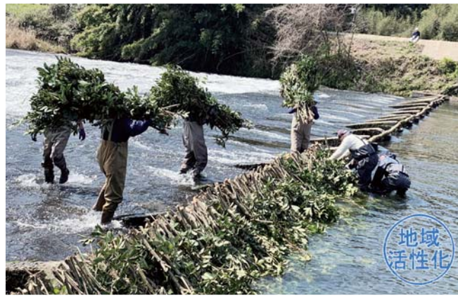
堰に柴を掛ける様子

口周辺を清掃。新しい柴束を担いで堰の上流側に設置しました。作業は約4時間に及びました。近くに住むJAの組合員は「柴掛けは、地域の春の風物詩。おかげで、今年も田植えができる」と感謝しました。