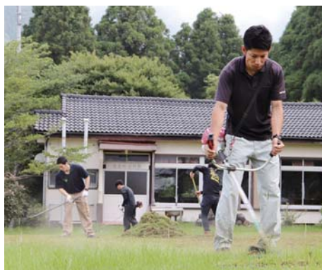
除草作業に取り組む鹿屋支所の役員ら（花里公民館）