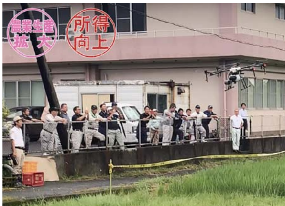
デモ飛行を見守る参加者ら

鹿屋市は今後、普通期水稲での除草剤散布、サツマイモでの殺虫剤散布試験を実施する予定です。