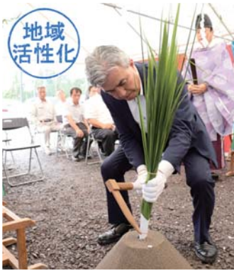
工事の安全を祈願し、刈初の儀を行う下小野田社長

集し、全44候補の中から「麺屋（めんや）きもつき」に決定しました。店舗は、12月のオープンを予定しています。