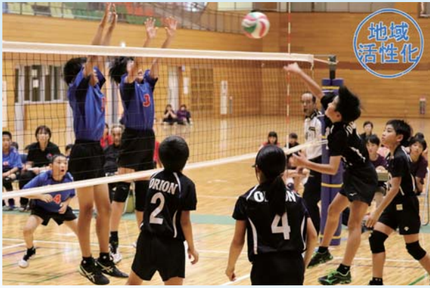
熱戦を繰り広げる選手ら

同JA管内2市4町のスポーツ少年団やクラブなど全29チームが出場。鹿屋市と東串良町の3会場で熱戦を