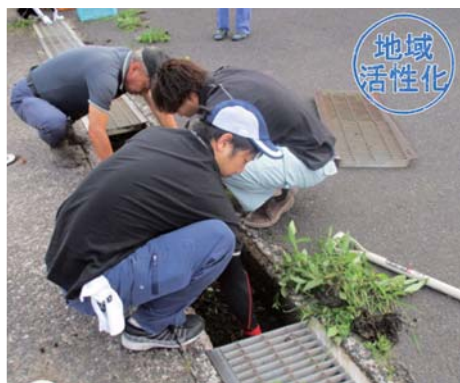
清掃作業に取り組む役員ら（大根占支所）