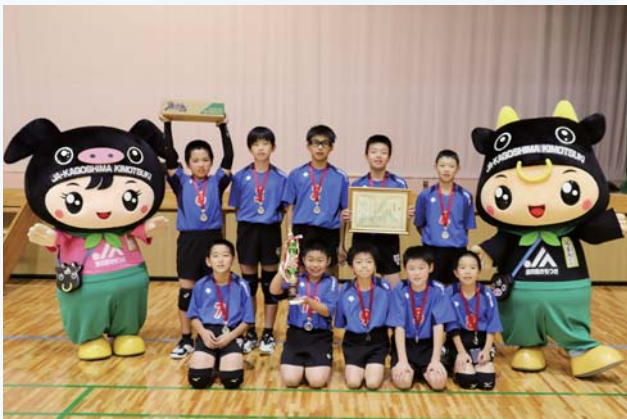
準優勝・寿北（男子）