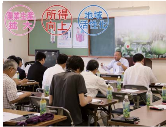
事業計画について話し合う出席者

当JAと肝付町、南大隅町は、両町特産の「辺塚だいたい」の生産拡大や販売の強化を目的に「辺塚だいたい産地化推進協議会」を設立しました。