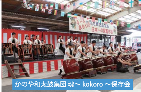
かのや和太鼓集団 魂～kokoro～保存会