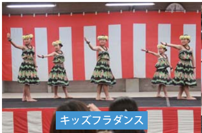
キッズフラダンス

管内産の食材を使った「きもつき屋台市」では、焼きそばやカレーライス、炊き込みご飯や茶美豚コロコロ焼き、JA女性部のでん粉団子汁などを販売。終日にわたって来場者が列を成しました。