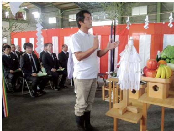
玉串を奉納する児島会長

を選果・包装できます。2019年5月に選果機の設置を行うまで集荷場の工事は続くため、2019年の作付分から本格稼働します。