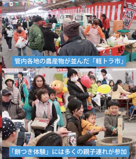
管内各地の農産物が並んだ「軽トラ市」