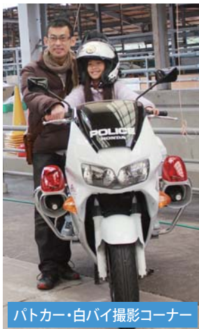
パトカー・白バイ撮影コーナー