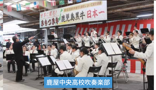
鹿屋中央高校吹奏楽部

8日は、迫力のある力強い和太鼓演奏で祭りの開幕を飾りました。9日は、昭和アイドルの名曲やクリスマスソングメドレー、大河ドラマ「西郷どん」のテーマなどがオープニングで演奏されました！