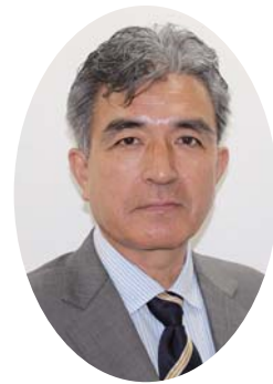
鹿児島きもつき農業協同組合 代表理事組合長