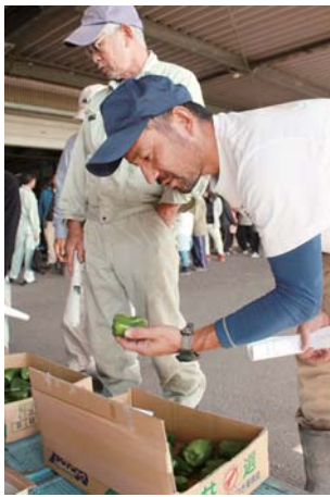
変形果などの実物を手に取り、出荷規格を確認する生産者

また、12月3日には同振興会キュウリ部の目揃え会も開かれ、生産者ら約125名が出荷規格を確認しました。