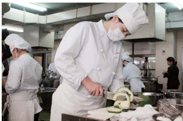
コンテストに臨む生徒ら

粉の代用もできたので、小麦アレルギーを持つ人への食事としても将来性が見えた」と話しました。