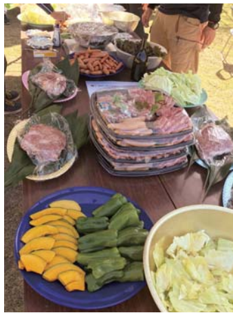
JAが用意したバーベキューの厳選食材

誕生。参加した女性らは「おいしいお肉や野菜を食べながら交流でき、地域の魅力を知ることができた」「農業について教わることができ、改めて農業に携わる男性に魅力を感じた」などとイベントの感想を語りました。