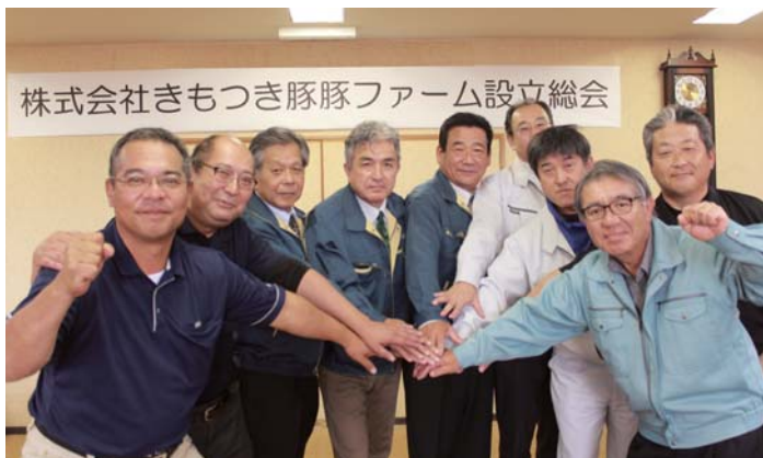
力を合わせて事業拡大を目指す同社の役員ら

当JAは、遊休施設等を活用し、養豚の新規就農者や後継者の育成・確保を目指した子会社「豚豚（とんとん）ファーム」を設立しました。