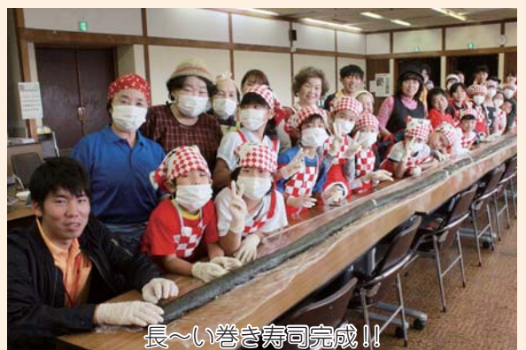
長〜い巻き寿司完成！！