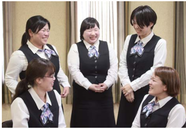
「きもつきアンバサダープロジェクト」のメンバー

J A 鹿児島きもつきで2日、J A や管内の魅力をもっと発信しようと、女性職員らでつくる「きもつきアンバサダープロジェクト」が発足しました。