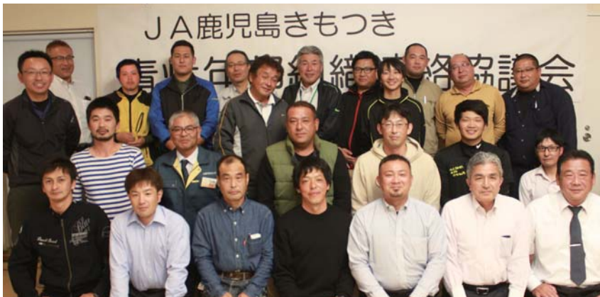
発足に集った青壮年組織の代表とJA役職員ら

協議会は、同深緑会の他、肝属肉牛青年部会や肝属和牛生産青年部会、きもつき豚豚後継者倶楽部、串良町肉用牛青年部、東串良町園芸振興会青壮年部、JA青壮年部内之浦支部、JA青年部鹿屋支部の代表で組織します。