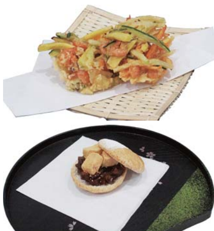
最優秀賞を受賞した2品