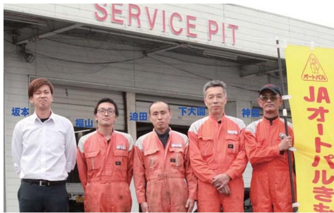
車検も「オートパルきもつき」にお任せください！

込み、お引き取りについても割引が適用され、大変お得になっています。車検証に記載されている「車検満了日」の1ヶ月前から、車検が受けられますので、この機会に、オートパルきもつきをご利用ください。