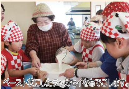
ペースト状にしたラッカセイを布でこします。

完成した巻き寿司は約9斤。女性部員特製のさつま汁と、最初に作ったラッカセイ豆腐と一緒に、参加者全員でおいしく食べました。