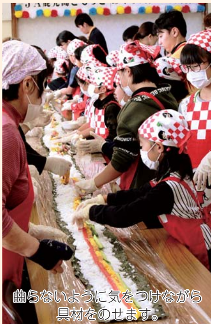
曲らないように気をつけながら具材をのせます。