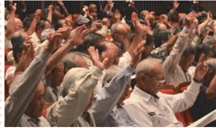
昨年度の通常総代会の様子