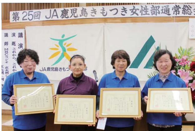
表彰された各支部の代表者ら

JA鹿児島きもつき女性部は4月17日、JA本所で第25回通常総会を開き、各支部の部員やJA役員ら約130名が出席しました。