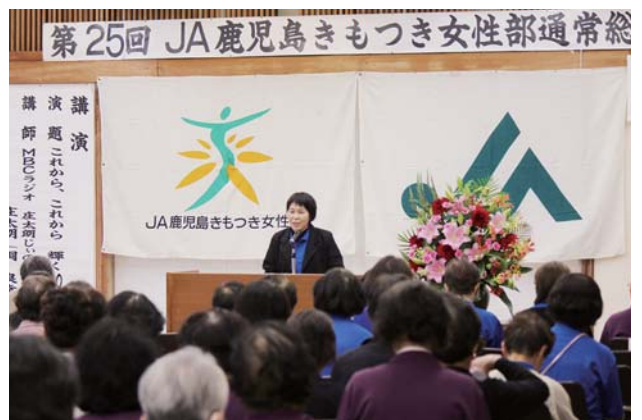
あいさつする新村部長