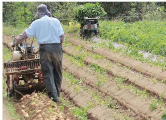
「なんぐう地区のバレイショ」の収穫 (根占地区)

かごしまブランドに指定されている「なんぐう地区のバレイショ」の出荷がピークを迎えています。 同地区産のバレイショは、163畝を約440名で栽培しています。 例年は2月下旬に佐多地区から収穫が始まり、地区を北上しながらリレー出荷されますが、平成30年産は定植時の長雨や、その後の日照不足、寒波の影響などで生育が遅れ、前年より10日ほど遅いペースで出荷が進んでいました。 JA根占支所によると、「遅れていた収穫も生産者の協力で順調に集荷が進み、4月中下旬に出荷ピークを迎えた。前年に比べるとやや収量は少ないが、品質は良好。」とい