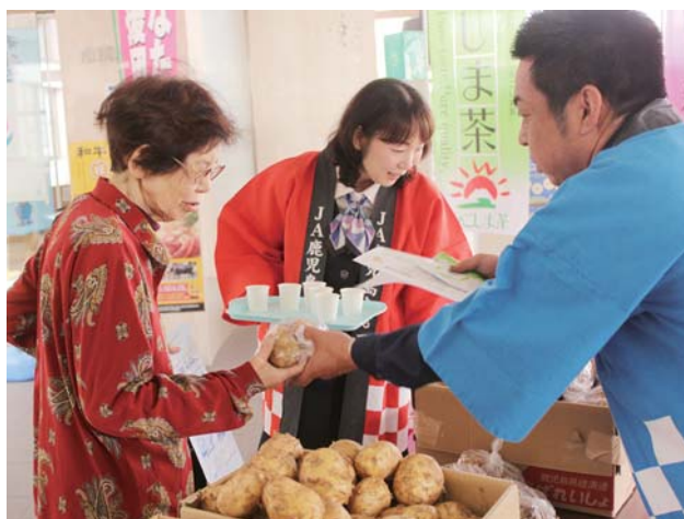
来場者に消費拡大を促すJ A職員ら

同J Aはさらに、管内の2市4町（鹿屋市・垂水市・東串良町・肝付町・錦江町・南大隅町）と、小・中学校の給食へ春バレイショを提供するための協議を進めています。