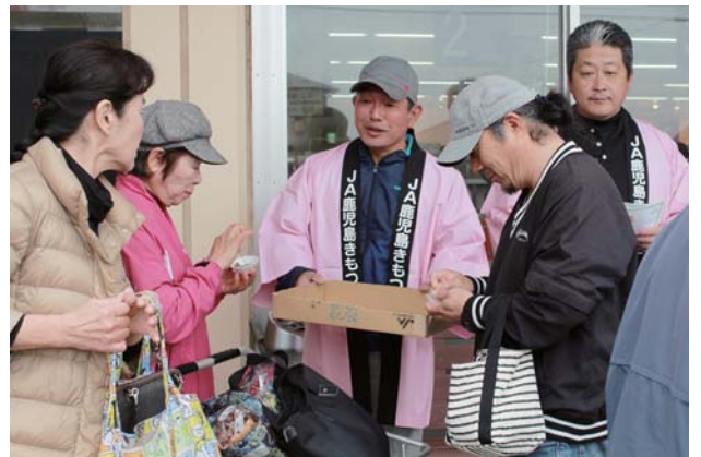
「茶美豚」をPRする生産者ら(Aコープ大始良店)

肝属茶美倶楽部は3月20日、ブランド豚肉「茶美豚(ちゃーみーとん)」の消費拡大を目的に、管内のAコープ2店舗でPR活動を行いました。 茶美豚は、緑茶由来のカテキンやサツマイモなどを飼料に使った豚肉で、普通の豚肉と比べて、ビタミンEや、旨み成分であるイノシン酸を多く含みます。 PR活動には、茶美豚の生産者やJAなど約20名が参加。茶美豚のモモ肉とバラ肉約15kgを炭火で焼いた「ココロ焼き」に調理し、2店舗の来店客に振舞いました。茶美豚についてもっと知ってもらおうと、手作りのパンフレットも配りました。 試食した来店客は「特に脂身が