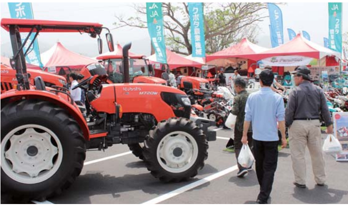
大型農機を見る来場者ら

広い会場内に、最新鋭の大型機械や中古農機、鎌などの小物までが並び、大勢の来場者で賑わいました。鹿屋市から訪れた来場者は「初めて来たが、こんなにたくさん展示されているとは知らなかった。来年は妻や近所の人と一緒に来たい」と語りました。