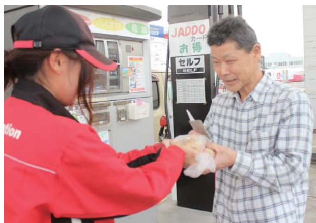
給油した利用客に消費拡大を促す様子 (J A—S S白崎セルフ)