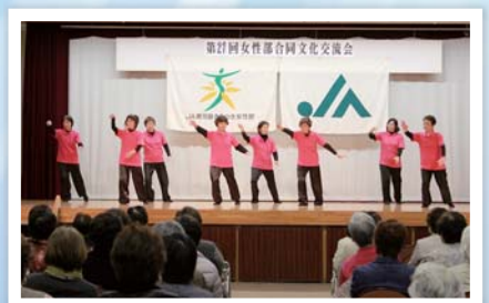
大根占「太極拳『涙そうそう』」