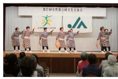
東串良「伊那の勘太郎」