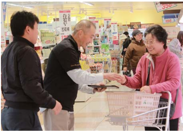
来店客へ試食を促す生産者ら（Aコープ大始良店）

黒豚を試食した来店客は「脂身が甘くて、肉質も軟らかい」と話し、黒豚精肉のパックを手に入れました。同会では今後も定期的に、地産地消を目的とした販売促進活動を行う予定です。