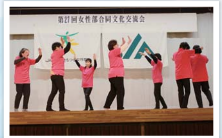
垂水「新鹿児島音頭／あゝ上野駅」