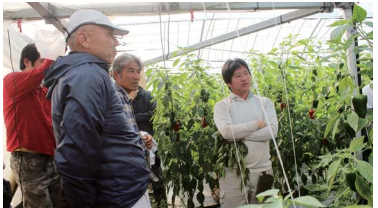
栽培状況を確認する生産者ら