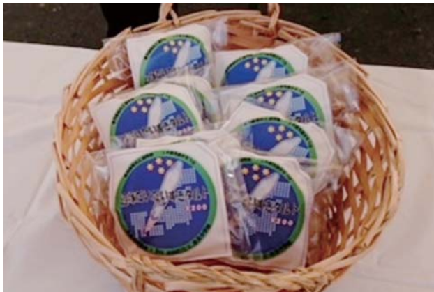
JAと生徒らで考案した辺塚だいだいすきタルト」