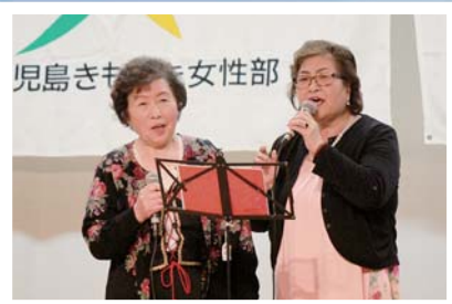
内之浦「幸せとおりゃんせ」