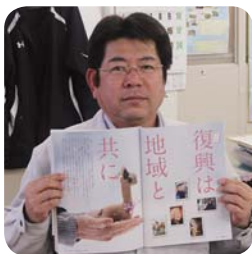
本所 地域みらい開発部 部長