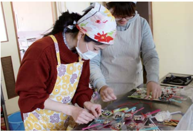
スプーンチョコをラッピングする参加者

J A女性部フレッシュユミズは2月5日、バレンタインデーを前に、JA本所で「チョコ作り教室」を開き、部員や地域の若い女性らが参加しました。