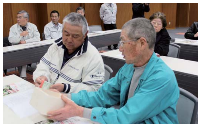
新開発の商品を確認する生産者ら

生産者と当JAは、オリジナル飲料「辺塚だいたいジュース」などのPRを中心に、中国や台湾へも販路拡大を図る一方で、新しい加工品の