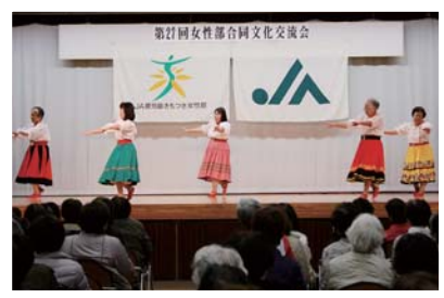
田代「南の花嫁さん」