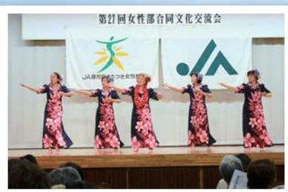
高山「エフリマコウ／天使の誘惑」