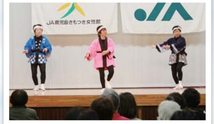
鹿屋「ガッツイ音頭」