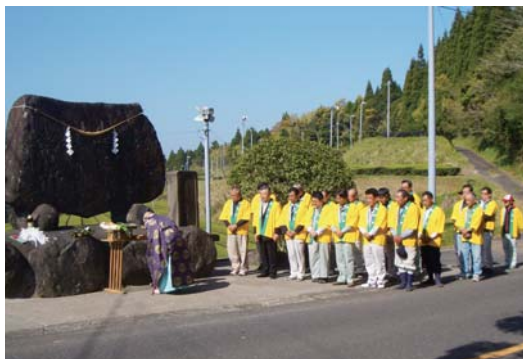
記念碑の前に関係者らが集まり献茶祭