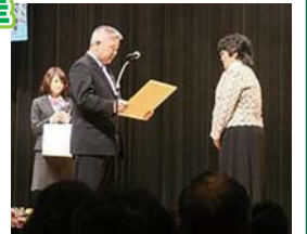
北郷経済連会長より 感謝状の授与