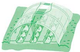
狭幅フィルムを2枚合わせて掛け、頂部を開き換気する

トンネルにはビニールまたはポリエチレンフィルムを覆い、裾には十分土を掛けて密閉し、地温の上昇を図ります。日が当たっても発芽するまでは換気する必要はありません。土が乾き過ぎたら週1回ぐらいフィルムを除いて灌水してください。 発芽して本葉が1〜2枚になったら、図のように頂部に小穴を開けて換気し、温度の過上昇を防ぎます。フィルムに穴を開けたくないなら、狭幅フィルムを2枚合わせにし、ておき、頂部を開いて換気してもよいです。裾を開けると両裾に寒風が入り、また風で飛ばされてしまうので失敗します。 育つにつれて適宜間引き、灌水、追肥を行い、暖かくなるにつれて裾開け換気し、生育の様子を見ながらフィルムを次第に開け、十分暖かくなれば昼夜も全開にします。 根の肥大状況を常に観察し、食べられるようになつたら逐次収穫しましょう。