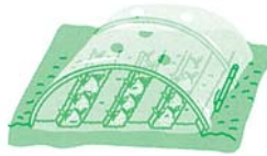
育つにつれて穴開け換気 →裾開け換気へ