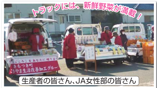
生産者の皆さん、JA女性部の皆さん

平成26年12月21日(日) 東九州自動車道鹿屋・申良JCTの開通、並びにそこから接続する、大隅縦貫道が笠之原ICまで開通したのを記念したセレモニーとして、Aコープ大始良店の駐車場にて、「トラック市」を開催！開通したばかりの道に乗ってきたお客様をお迎えしました！