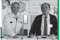
私たちが厳正に抽選致しました。